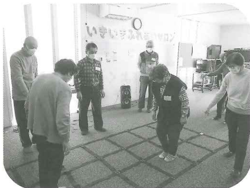
1月のふまねっと運動の様子

第10回目のいきいきふれあいサロンは、令和6年1月18日(木) 介護予防センターで開催。