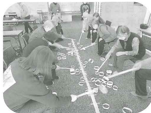
12月のゲームの様子

午後のレクリエーションは、棒と紙の輪を使って「陣取り合戦」のゲームを行い、白熱した戦いが繰り上げられました。