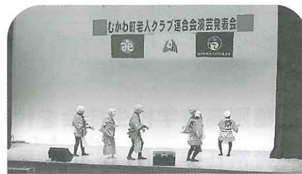
友愛クラブ 6名の皆さま