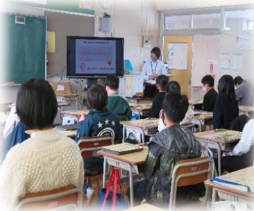
ボランティア講座