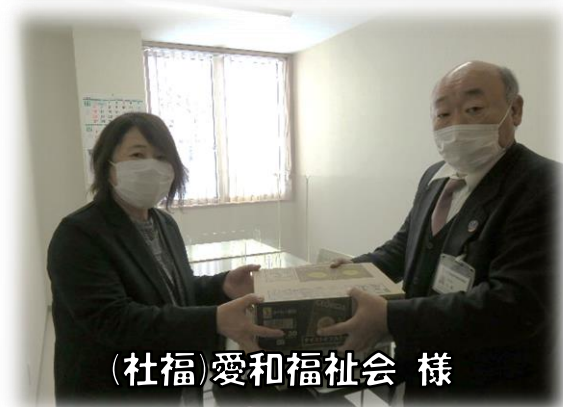
(社福)愛和福社会 様