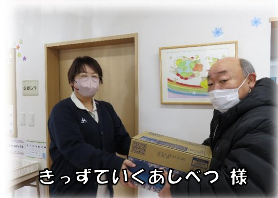
きっずていくあしべつ 様