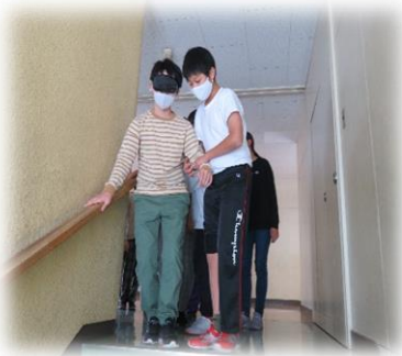
視覚障がい者歩行体験