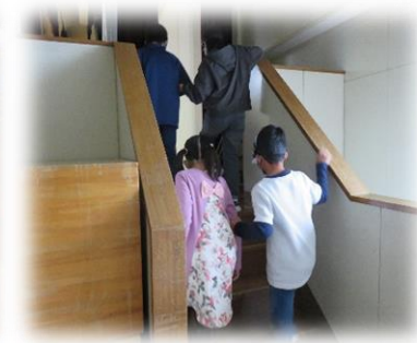
視覚障がい者歩行体験

上芦別小学校4年生の総合的な学習の時間において手話や点字などの障がいに関する福祉体験学習が行われました。