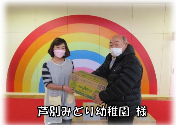
芦別みどり幼稚園 様