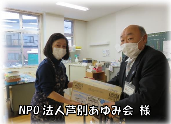
NPO 法人芦別あゆみ会 様