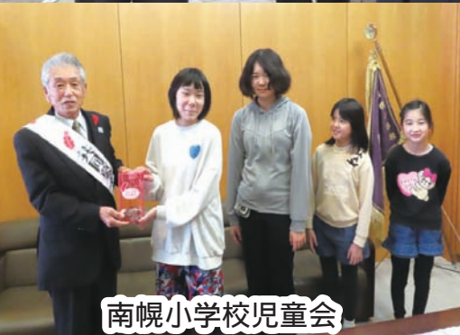
南幌小学校児童会