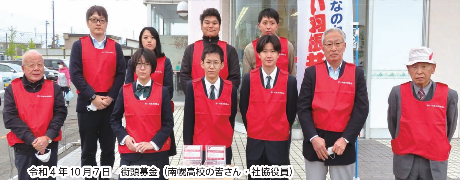
令和4年10月7日 街頭募金 (南幌高校の皆さん・社協役員)

共同募金活動にご協力いただき、ありがとうございました！ たくさんの方々にご協力いただき感謝申し上げます。