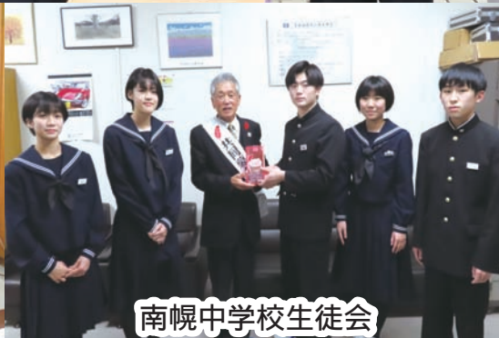
南幌中学校生徒会