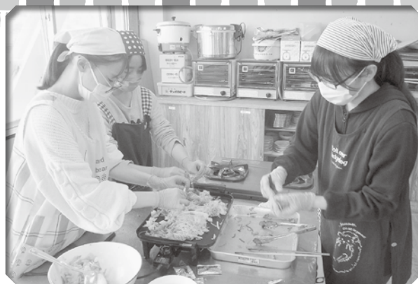
▲調理をする高校生の皆さん

今回はキャベツ、人参、玉ねぎなどの野菜をたっぷり使った焼きそば、大きく育ったカボチャのサラダ、JA摩周湖農協様よりいただ