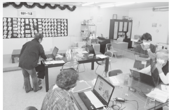
▲パソコンを参加者同士で教え合う風景