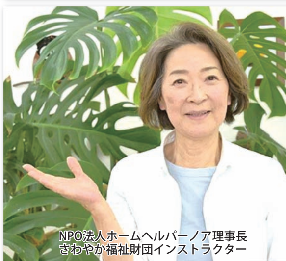
NPO法人ホームヘルパーノア理事長 さわやか福祉財団インストラクター