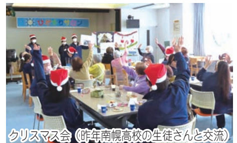
クリスマス会（昨年南幌高校の生徒さんと交流）

※上記の日程で開催を予定していますが、中止・変更となる場合があります。クリスマス会は事前のお申込みが必要となります。（TEL 378-2088）皆さんでゲームをして楽しい時間を過ごしましょう！今年も南幌高校の生徒さんとの交流を予定しています。少しですが、クリスマスプレゼントもあります♪