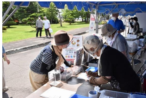
▲赤い羽根共同募金ブースの様子