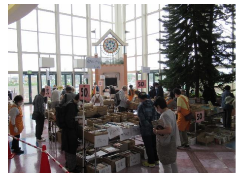
▲ 古本リサイクル市の様子

この事業の収益金は、福祉活動への寄付として釧路市内へ還元させていただきます。本の寄贈をいただいた皆様、会場にご来場いただきました皆様、ご協力ありがとうございました。