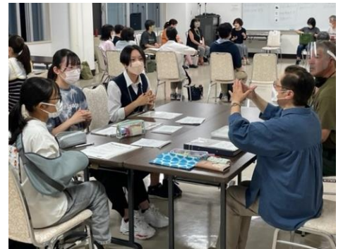
▲ ボランティア体験（手話）の様子

参加した児童・生徒たちは体験にあたってそれぞれ目標を持って臨み、自身の成長につながる発見や体験ができたと話していました。とくに今年度は釧路市ボランティア連絡協議会主催の「古本リサイクル市」でのイベントボランティアも体験プログラムとしており、日常とは違ったイベントならではの接客や他者との交流を通して様々なことを学べたとの感想をいただきました。