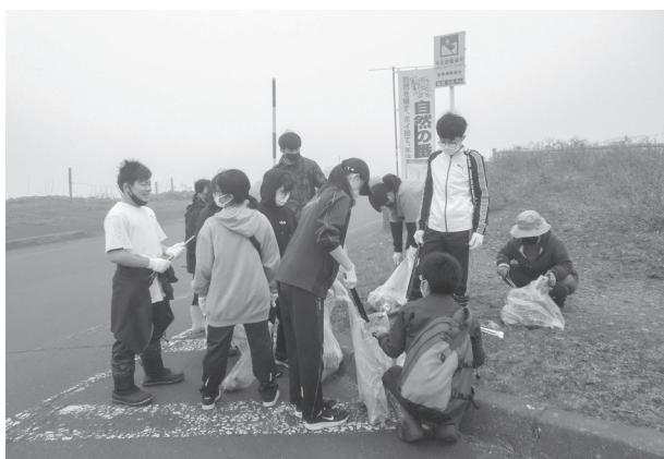
「中・高校生ボランティアリーダー養成講座①」(湿原クリーン作戦)