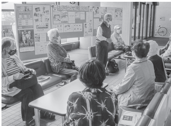
「自然観賞研修会」(総合文化センター)