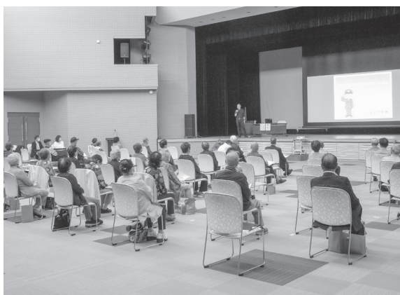
「釧老連東ブロック研修会」(総合文化センター)

新型コロナウイルス感染症の影響により、各事業の中止や縮小が2年間ほど続いていましたが、令和4年度に入り、感染対策をしながら、事業を実施しています。最近の社会福祉協議会や団体の事業再開を一部ご紹介します。