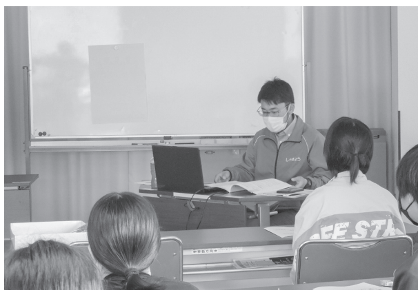
「中・高校生ボランティアリーダー養成講座②」(ボランティアの基礎学習)