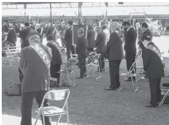
「北海道護国神社参拝」(旭川市)