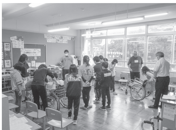
「福祉、介護についての学習講座」(霧多布小学校4年生)