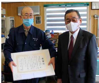
株式会社 安川測量 様 旭川市東鷹栖東3条4丁目