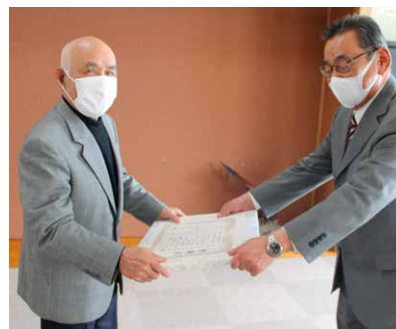
当麻町老人クラブ連合会 様 当麻町4条東2丁目