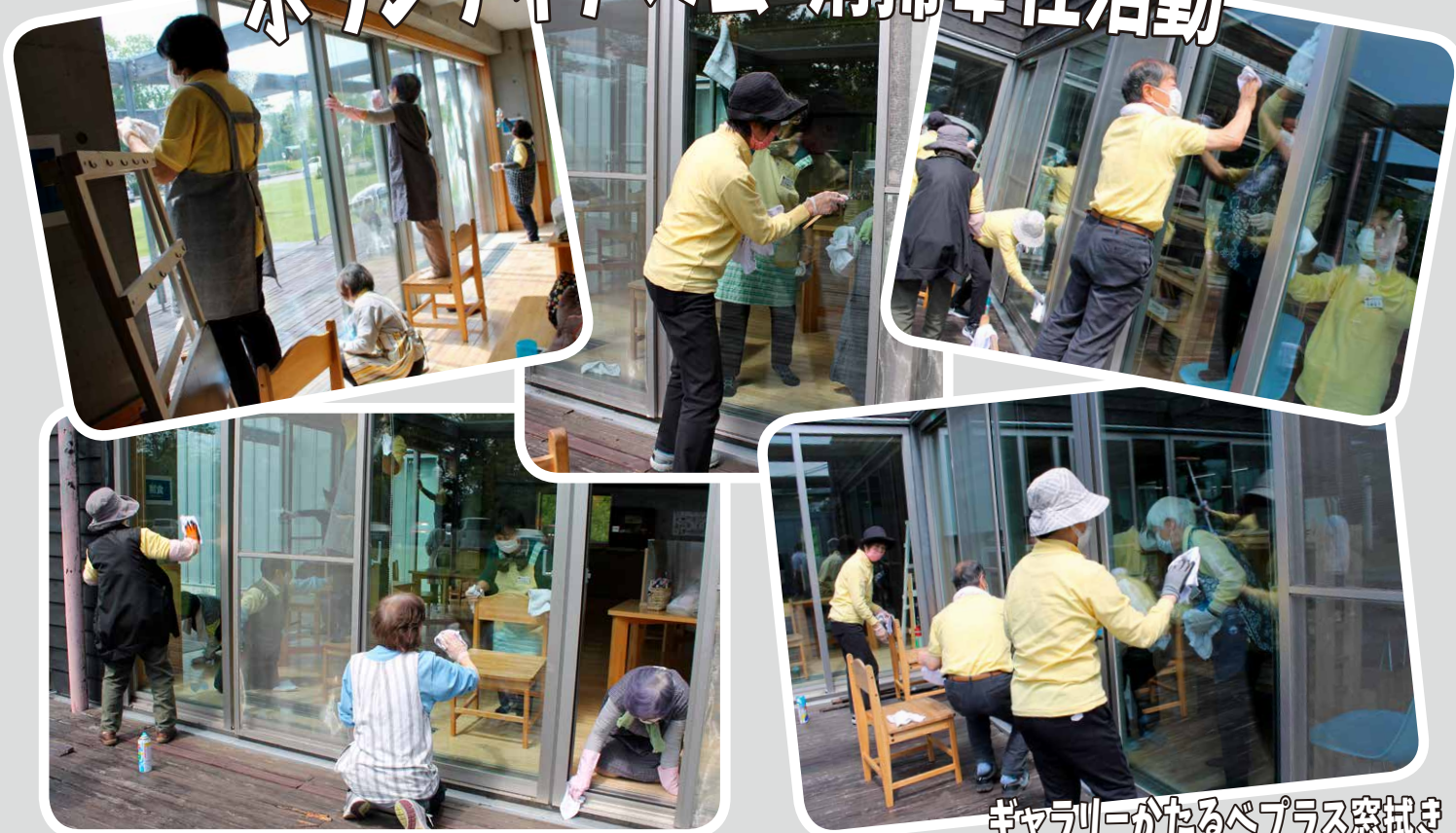
ギャラリーがたるペプラス窓拭き