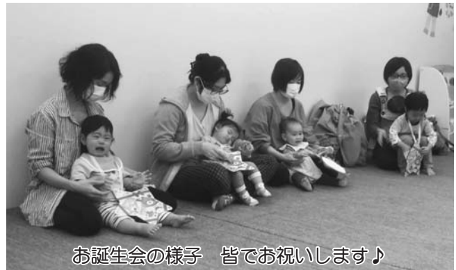
お誕生会の様子 皆でお祝いします♪