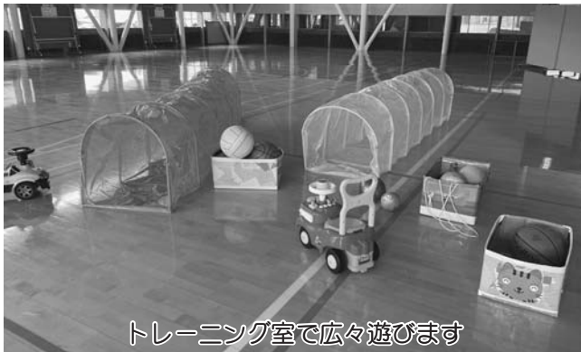
トレーニング室で広々遊びます