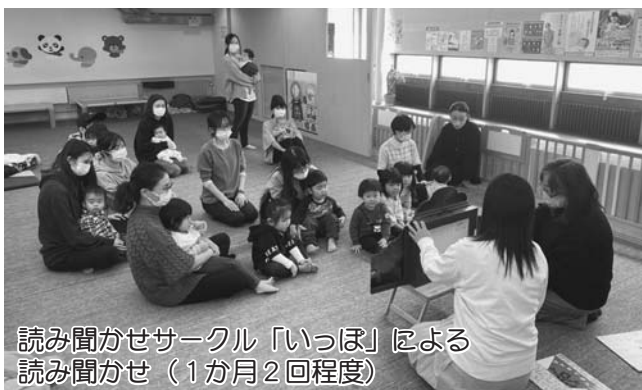
読み聞かせサークル「いっほ」による 読み聞かせ（1か月2回程度）