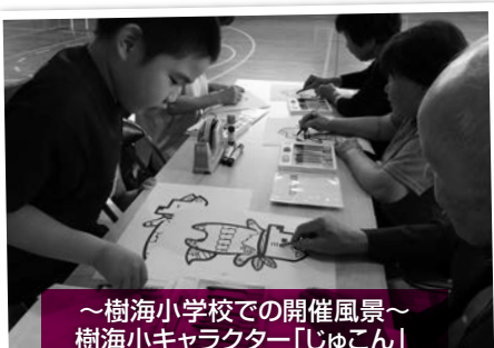
～樹海小学校での開催風景～ 樹海小キャラクター「じゅこん」 のぬり絵を一緒にしました