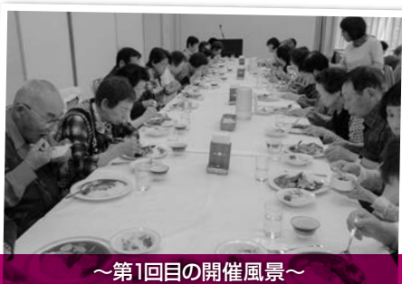
～第1回目の開催風景～ シーフードカレーぴりっと辛くて美味しいな