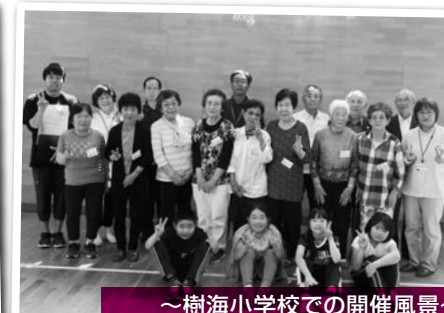
～樹海小学校での開催風景～ みんなで記念撮影ハイ!チーズ☆