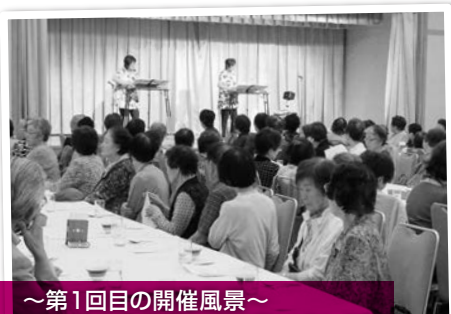
～第1回目の開催風景～ 大正琴の演奏と一緒に歌いました

扇山小学校のふれあいの集いは10月を予定していますので、参加対象者の方はぜひ参加してくださいね。