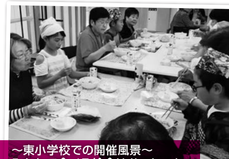
～東小学校での開催風景～ みんなで食べる給食はおいしいね