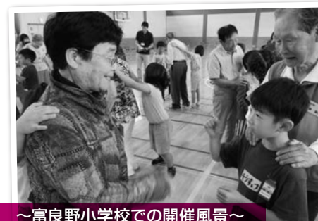
～富良野小学校での開催風景～ じゃんけん列車をしました