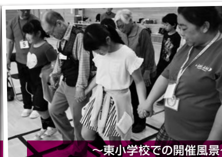
～東小学校での開催風景～ 手を繋いでふまねっと運動をしました