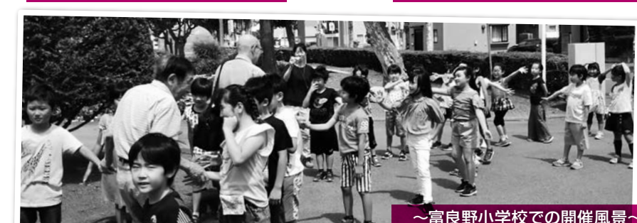
～富良野小学校での開催風景～ お見送りをしてもらいました