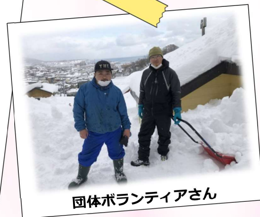
団体ボランティアさん