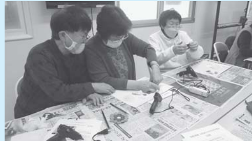
貼り付けには、グルーガンを使用しました