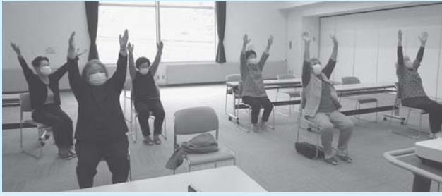
新型コロナウイルス感染防止・介護予防を兼ねた「3蜜2活」の取組み