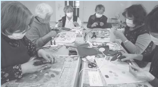
フェルトで小さい丸をたくさん切って、色味も考えて指と頭と両方使いました