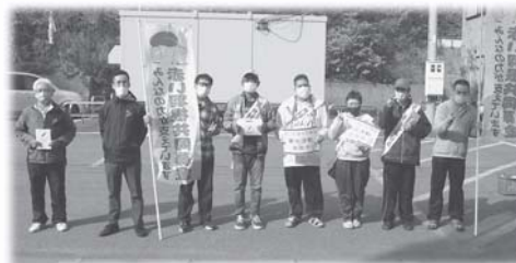
礼文町うすゆきの会

礼文町共同募金委員会 (礼文町社会福祉協議会内) 電話 0163-86-2003