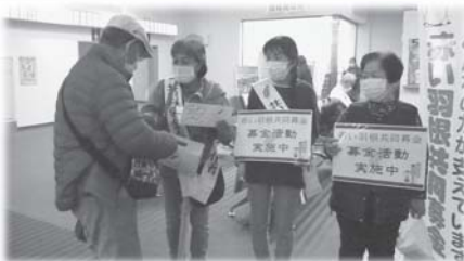
礼文町身体障がい者福祉協会