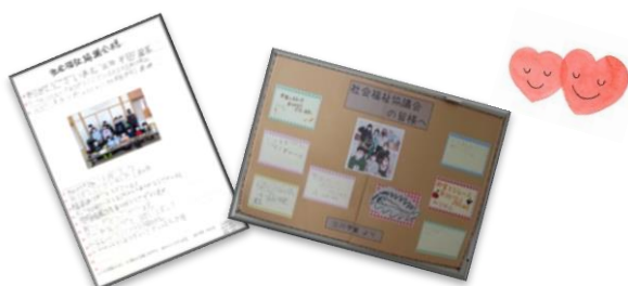
▲由仁地区・三川地区学童クラブから歳末たすけあい見舞金の礼状が届きました。