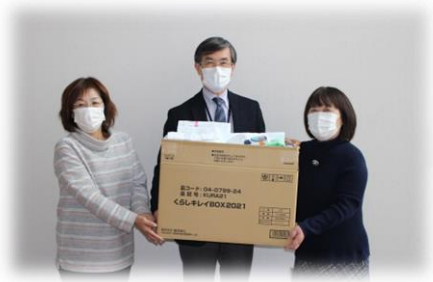
▲由仁町商工会女性部様からのタオルの寄贈は、福祉施設等へお届けしました。ありがとうございました。