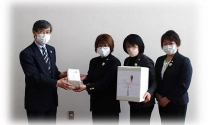
▲JA そらち南女性部様からのタオルの寄贈は、福祉施設等へお届けします。ありがとうございました。