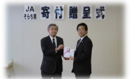
▲そらち南農業協同組合・(株)メリーワーク様から寄付をいただき車いすや歩行器等を購入しました。◀