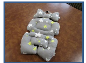
新生児用クッション