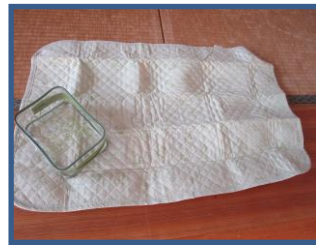
おむつ替えシート