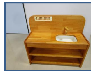
おままごとキッチン