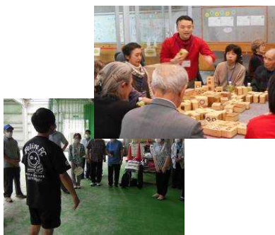
社協職員派遣・外部講師紹介