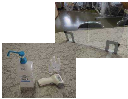
感染予防資材貸出