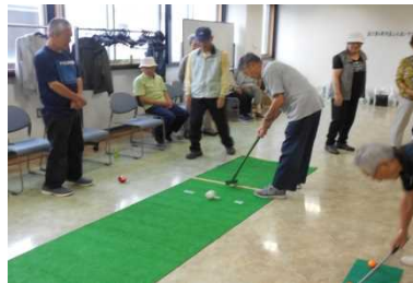
軽スポーツ・レクリエーション (各種遊具貸出あります)