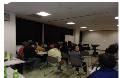
映画鑑賞・学習会 (スクリーン・プロジェクター貸出あります)