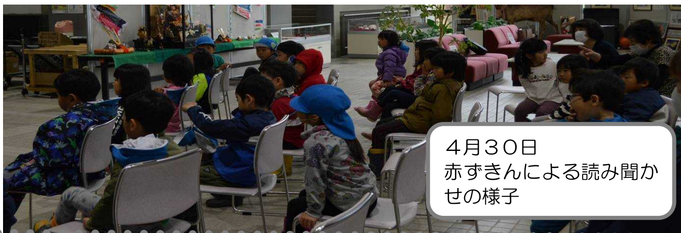
4月30日 赤ずきんによる読み聞かせの様子