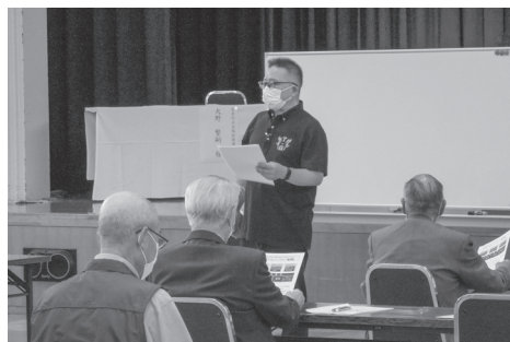
東ブロック研修会