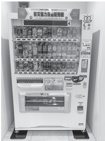
1階 コカ・コーラボトリング