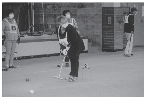
鉏路地区老人クラブ連合会主催のゲートボール大会