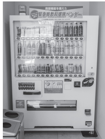
3階 サントリービバレッジサービス