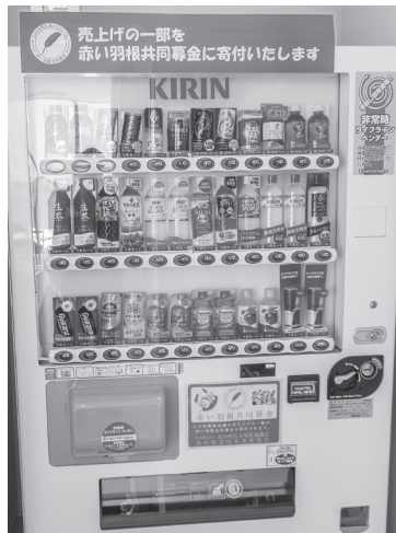
2階 キリンビバレッジ