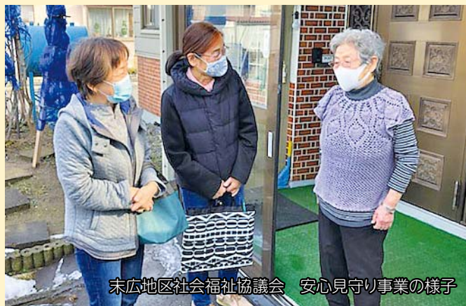
末広地区社会福祉協議会 安心見守り事業の様子

病気や障がい・高齢等で、日常生活に不安を抱えている方などを隣近所の住民同士で見守る活動です。活動を通して、不安や孤立感を解消し、互いに安心して暮らすことができる地域を築くことを目的としています。マスク着用など、感染予防対策を実施しながら活動を続けています。