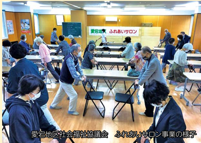
愛宕地区社会福祉協議会 ふれあいサロン事業の様子