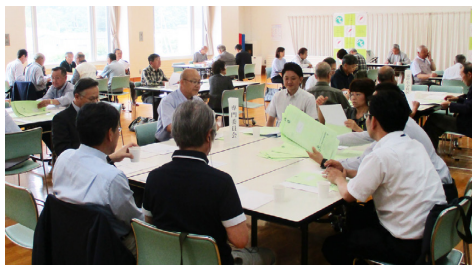
2018年のきずな推進委員会の様子

今年度は2022年から2026年まで取り組む第4期きずな計画の策定年度です。きずな推進委員会による検討や市民アンケート調査等を用いながら、市が進める「地域福祉計画」との一体的な策定を行います。