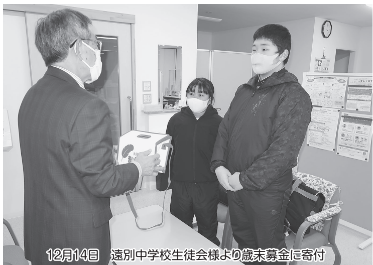
12月14日 遠別中学校生徒会様より歳末募金に寄付

歳末たすけあい募金は上記助成内訳の通り助成金と年末のおせち料理の配食に使用させて頂きました。これからも効果的な活用を目指して研究・検討を進めてまいります。