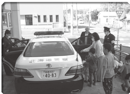
▲ワクワクしながらパトカー試乗体験中

10月に福祉センターで開催した「キッチンみちくさ」 では、弟子屈警察署の皆さんが、参加した子どもたちの ためにパトカー試乗体験を行ってくれました。参加した 子どもたちは、美味しいごはんを食べた後に普段できな い貴重な体験ができて、喜んでいました。