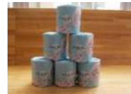
トイレットペーパー (100ロール)