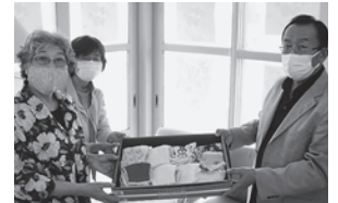
手作りマスクをご寄付いただきました。(生長の家空知教化部様より)

滝川市社会福祉協議会では、ご寄付いただけるマスクの受け取りを行っております。お寄せいただいたマスクは、必要とされる方にお届けいたします。