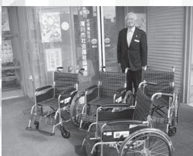
(株)ツルハホールディングス様・クラシエホールディングス(株)様より車椅子4台をご寄付いただきました。大切に使用させていただきます。

滝川市社会福祉協議会では、地域福祉を支える・進めるために皆さまからの温かいご寄付をお待ちしております。 ◎創立記念や開店記念 ◎フリーマーケットやチャリティコンサート開催 ◎葬儀の香典返しに代えてなど、お気持ちを届けたいだいております。 ご寄付につきましては所得税・住民税(個人の場合)の控除を受けられます。法人の場合は一定の限度額まで損金に算入することができます。 (ご寄付の控除詳細につきましてはお気軽にお尋ねください。)