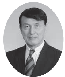
滝川市社会福祉協議会