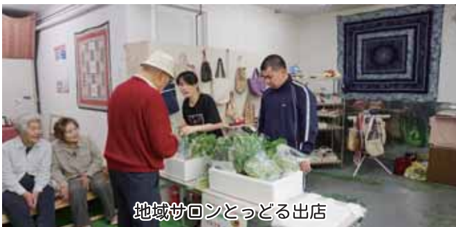
地域サロンとっどる出店