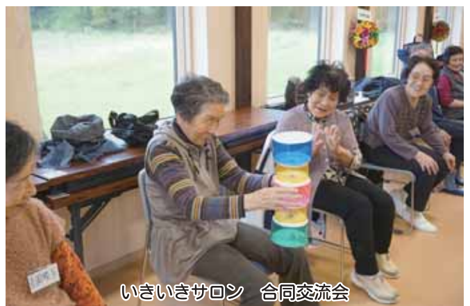
いきいきサロン 合同交流会

電話サービス事業の実施：稼働日数366日（利用者14名） 生活支援コーディネーター事業 地域ケア個別会議参加 地域課題収集