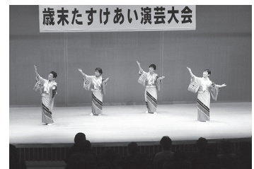
(歳末チャリティ演芸大会)

会員数の強化、家事援助サービスや草刈除草、除排雪業務等の作業を実施(受注件数1,161件)