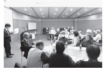
(小地域ネットワーク事業研修会)

見守りや支え合いにより、住み慣れた地域で安心して生活していくことのできる地域づくりが求められていることから、地域において参加者が自主的に企画、運営するふれあいの場づくりを支援し、生きがいづくりや社会参加を促進していくため、ふれあい・いきいきサロン事業を実施しています。令和元年度は5団体が積極的に活動しています。