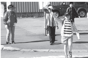
(子ども見守り街頭啓発)