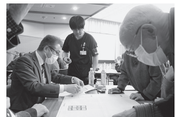
(ボランティアスクール)

生活支援員の協力のもと意思決定能力の不十分な方に対し、福祉サービスの利用援助・金銭管理の援助等により自立生活を支援