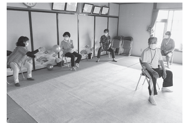
(ふれあい・いきいきサロン活動)