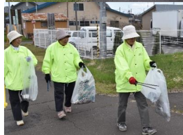
▲ 写真は昨年度の様子