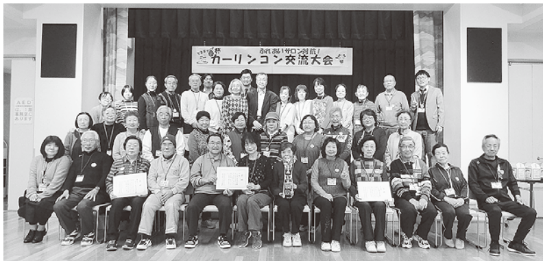
写真:ふれあいサロン運営者研修交流会「とまチョップ水杯カーリンコン交流大会」(令和2年1月30日開催)