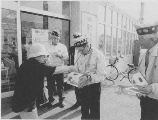
羽幌ライオンズクラブ様の街頭募金