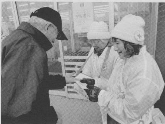
羽幌町日赤奉仕団様の街頭募金