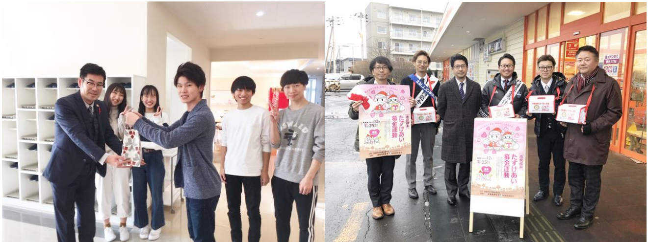
(左：孝仁会看護専門学校による校内募金・右：釧路北ロータリークラブによる歳末たすけあいの街頭募金)

赤い羽根共同募金運動・市民歳末たすけあい募金運動へのご協力 本当にありがとうございました。