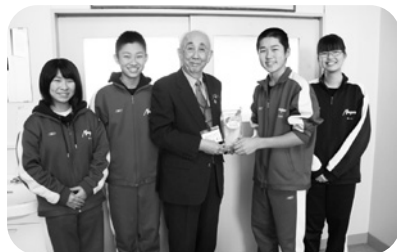
南幌中学校生徒会さん