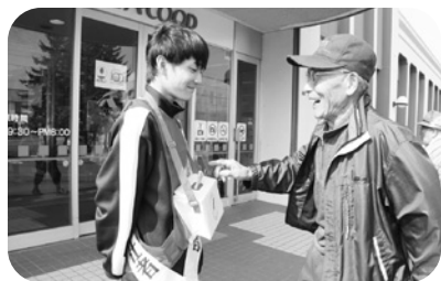
R1.10.2 街頭募金 (南幌中学校職場体験学習)