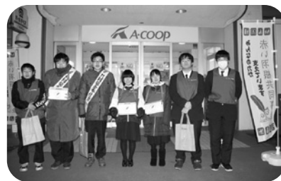
R1.11.19 街頭募金 (南幌高校生徒会)