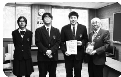
南幌高校生徒会さん