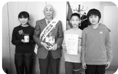
南幌小学校児童会さん