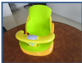
ベビーバスチェア