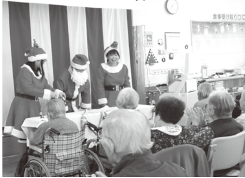
12月年末お楽しみ会 職員によるハンドベル演奏やマジックショー を楽しむ皆さん。