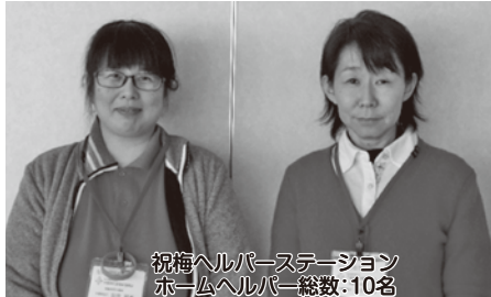
祝梅ヘルパーステーション ホームヘルパー総数:10名

自宅訪問型の福祉サービスを担う新富・祝梅ヘルパーステーションの職員です。皆様の自宅での生活を適切に支援できるよう職員一同頑張っております。