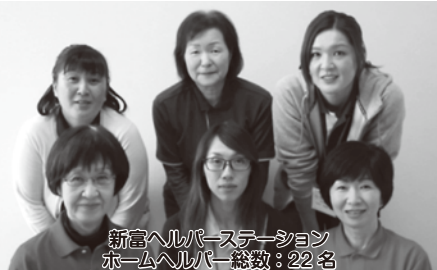
新富ヘルパーステーション ホームヘルパー総数:22名

【サービスの利用について】 ・上記の担当窓口又は、お近くの地域 包括支援センターへご相談ください。 【介護保険事業の空き状況】 ・当該事業は、混雑が見込まれます。 本会ホームページの「空き状況」等 でご確認ください。