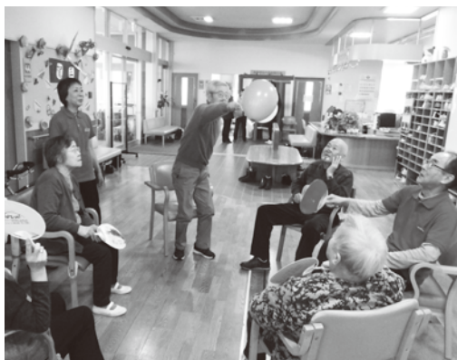
1月のお正月遊び いろはかるた取りや、風船羽子板に興じて、 にこやかな笑顔があふれていました。