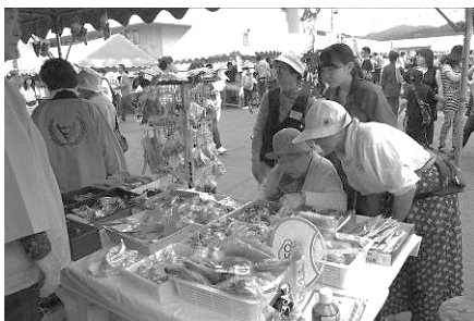
▲釧路市阿寒町ふれあい広場