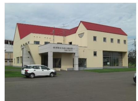
▲ 子ども広場が入居する音別町ふれあい図書館