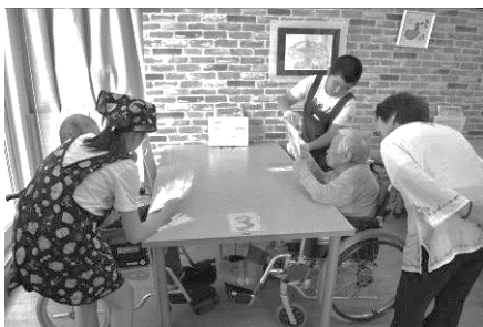
▲夏のボランティア体験・職業体験