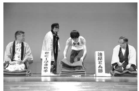
▲第34回チャリティーかくし芸大会