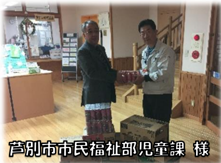
芦別市市民福祉部児童課様