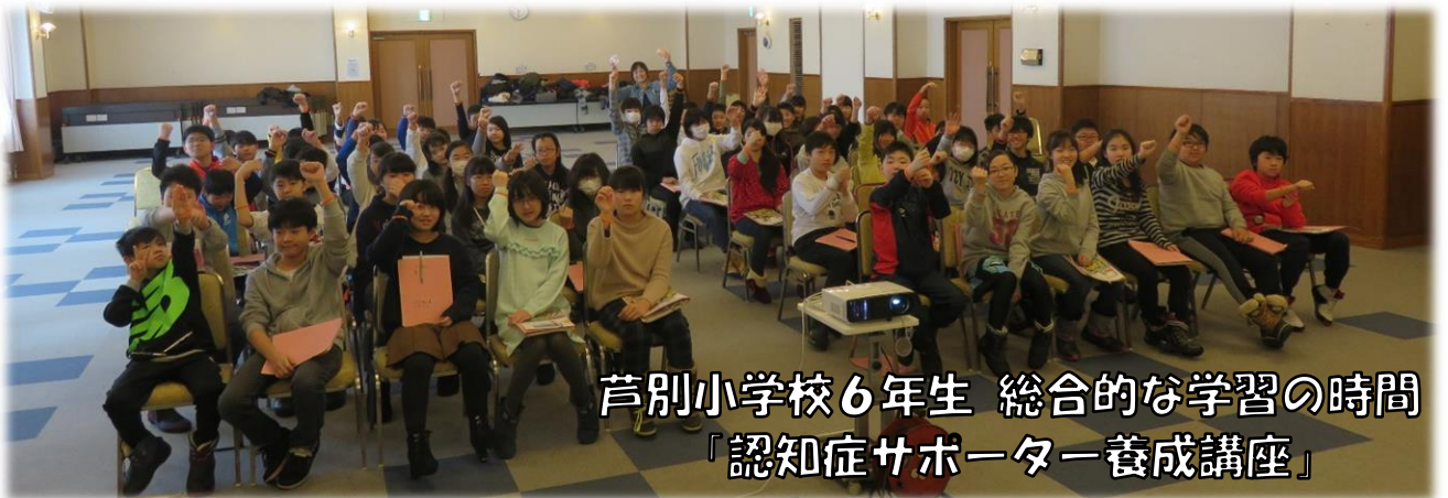
芦別小学校6年生 総合的な学習の時間 「認知症サポーター養成講座」