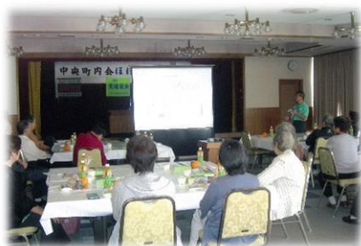
市内18の単位町内会 「ひとりぐらし高齢者支援事業」