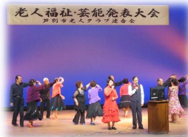
芦別市老人クラブ連合会 「老人福祉芸能発表大会」