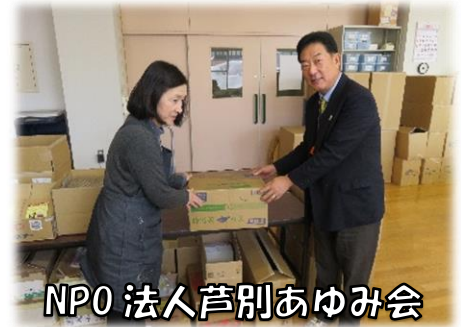
NPO 法人芦別あゆみ会