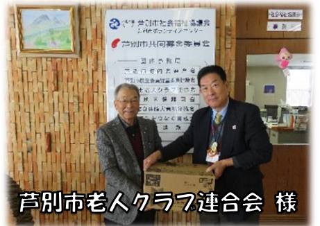
芦別市老人クラブ連合会様