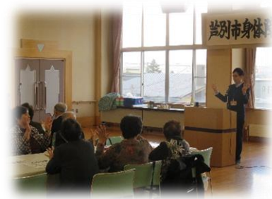
芦別市身体障害者福祉協会 「一日研修大会」