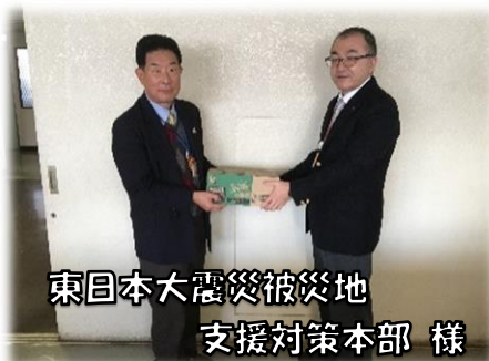
東日本大震災被災地 支援対策本部様