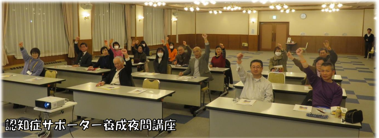
認知症サポーター養成夜間講座