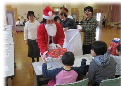
芦別市手をつなぐ育成会 「クリスマス集会」