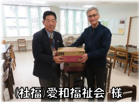
(社福)愛和福社会様