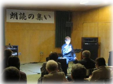
声のボランティアかりんとう 「朗読の集い」