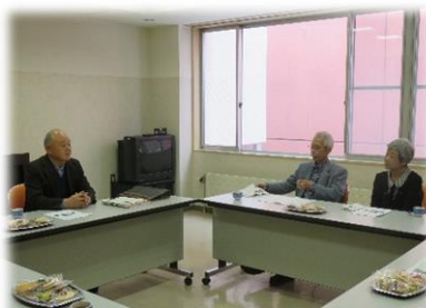
芦別市遺族会 「研修会及び新年交礼会」