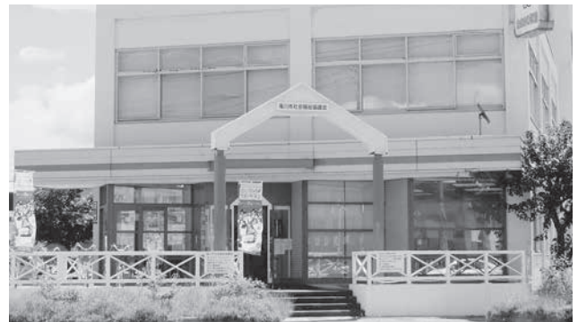
滝川市社会福祉協議会の玄関前（NTTビル1階） 向かって右側に駐車スペース（3台分）があります。