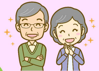
民生委員・児童委員

それなら、こんな情報があるよ！ わからないことがあれば、あそこに 連絡してみるといいよ！