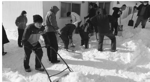
（雨竜高等養護学校除雪ボランティア）