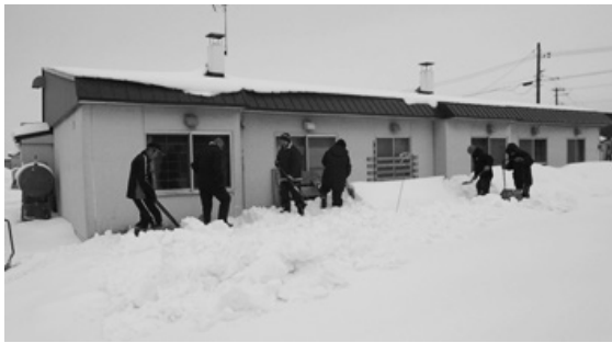
（雨竜町暑寒の里除雪ボランティア）

今年も1月29日から2月12日までの内、3日間にわたり、暑寒の里、雨竜高等養護学校2年生の方々延べ55名に独居高齢者住宅6戸の除雪ボランティアを行っていただき、皆さんに大変感謝されました。