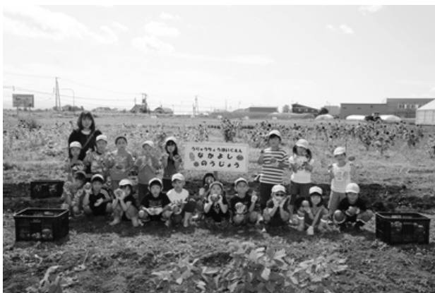
(なかよしのうじょうじゃがいも収穫9月)