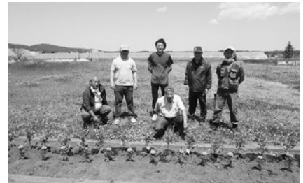
(環境美化花いっぱい運動活動6月)