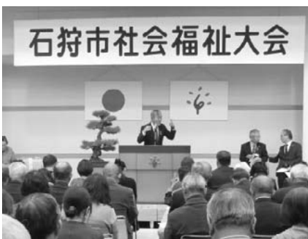
昨年の社会福祉大会の様子 280名の皆さまにご参加いただきました。