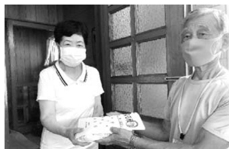
北陽町内会の皆さん

ける方法のみで実施しているところもあります。答えの正解不正解は重視していません。地域の方が月2回定期的な問題集をお届けすることで、お互いの様子がわかる交流の機会が短時間でもできること、問題の答えを自分で「考える」ことが大切だと考えています。すでに赤まる便りが届いている方は、難しいと感じる問題もあるかもしれませんが、正解不正解を気にせず気楽に解いてみてくださいね。 赤まる便り事業は、地域活動が制限されたコロナ禍における令和2年度特別事業（令和3年3月までを予定）です。また、お配りしている問題集は、石狩市ひきこもりサポートセンター相談室まるしえの職員、利用者、石狩市ボランティアセンター登録者の皆さんに製本作業をご協力いただいています。 途中からでも参加可能です！実施対象団体の皆さん、ぜひお気軽にご連絡ください！（個人での参加は出来ませんので、ご了承ください。）