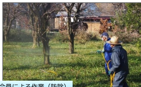
会員による作業（防除）