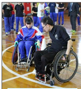
福祉学習（中央） * ラグビー用車椅子体験