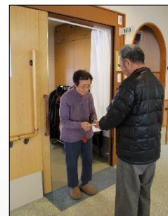
歳末義援金の配布

その他の事業も含め、地域の福祉を更に進めていくため、役職員一丸となって運営してまいります。