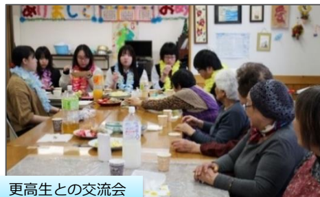
更高中生との交流会