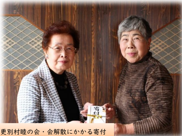
更別村睦の会・会解散にかかる寄付