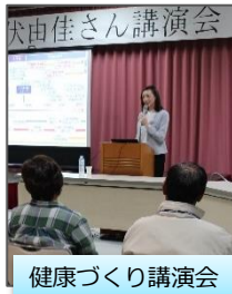
健康づくり講演会