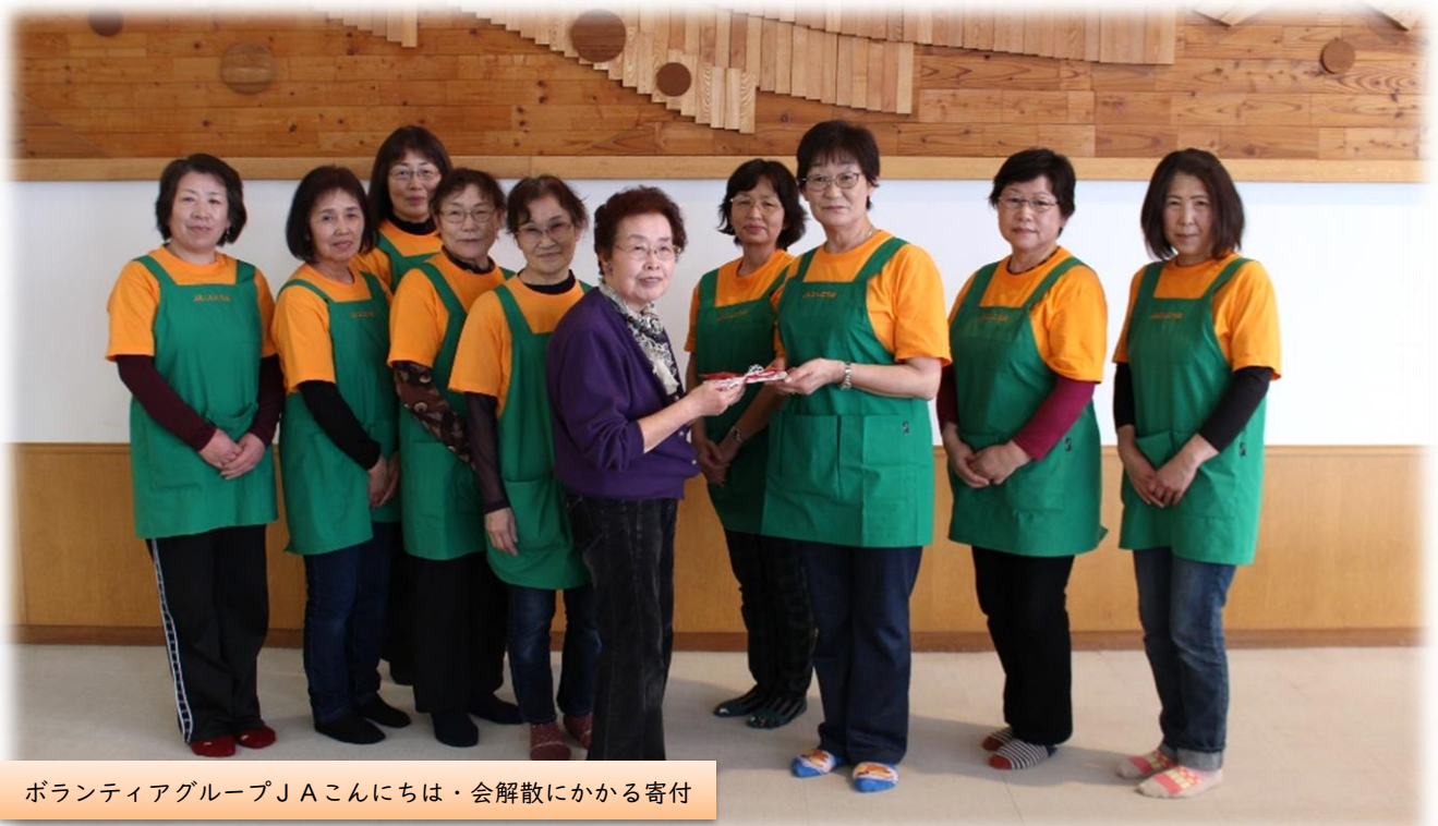
ボランティアグループJAこんにちは・会解散にかかる寄付