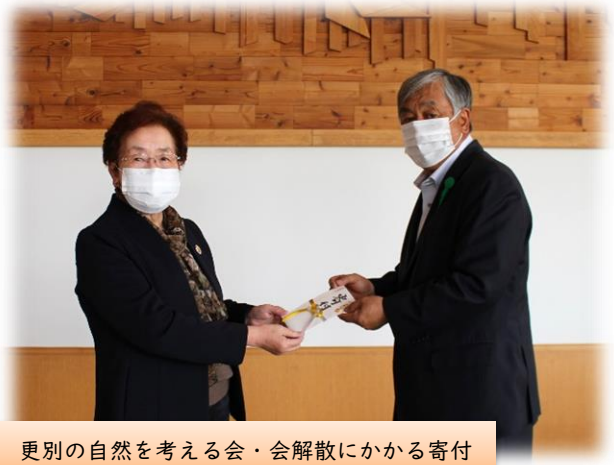
更別の自然を考える会・会解散にかかる寄付