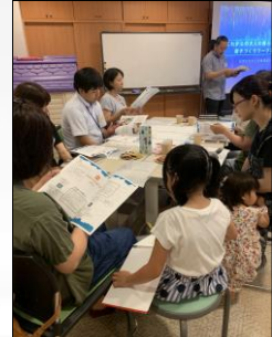
生活支援体制整備事業 「冊子づくりワークショップ」