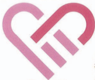
りんくるプラン ロゴマーク