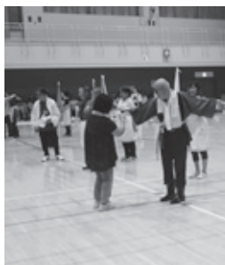
種目「かかしりレー」むぎわら帽子、半纏などを着つけ、「かかし」をいち早く完成させます。かかしの出来栄は如何に？

親睦と交流が目的ではありませんが、皆表情は真剣そのもので、勝った時は歓喜に沸き負けた時は残念な表情を浮かべるなど、ユニークな競技とはいえず、勝負事に対する熱意が感じられました。