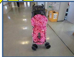
ベビーカーのカバー