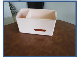
ベビーベッド用おむつケース