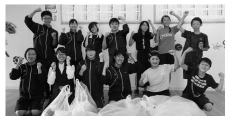
西部小学校・西部中学校生徒会 様