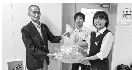
東部中学校生徒会 様