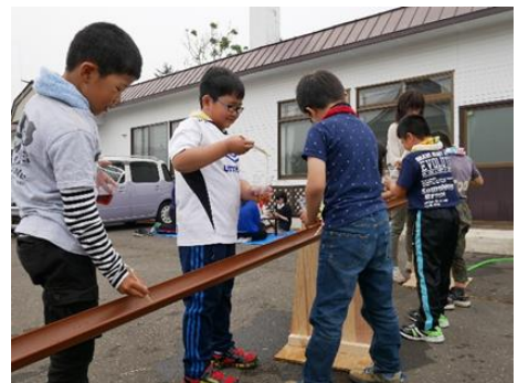
▲ 流しそうめんの様子