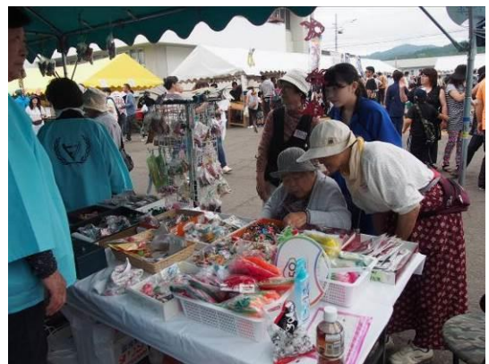
▲ 写真は昨年度の様子 (福祉団体による展示即売ブース)