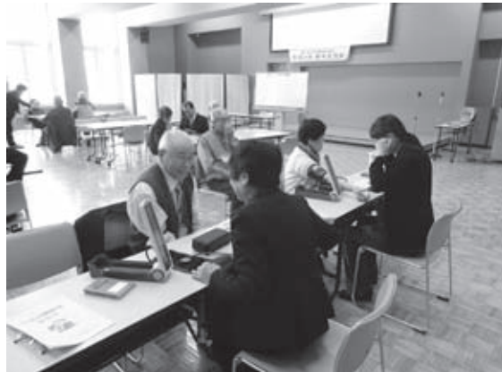
会員の健康相談と血圧測定の様子

樹町議会議長より祝辞が述べられた後、参加者全員で祝賀会食やビンゴゲームなどで楽しみ、会員相互の連携を深めました