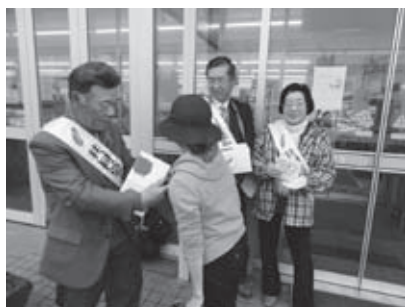
町内で協力を呼びかけた街頭募金