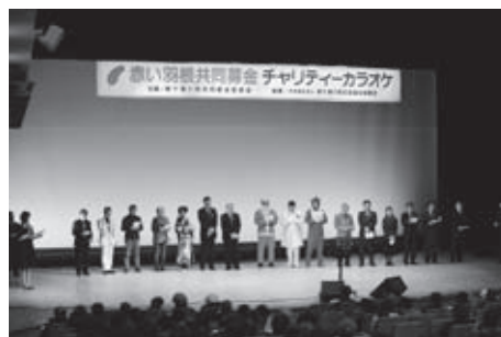
大盛況に終わったチャリティーカラオケ