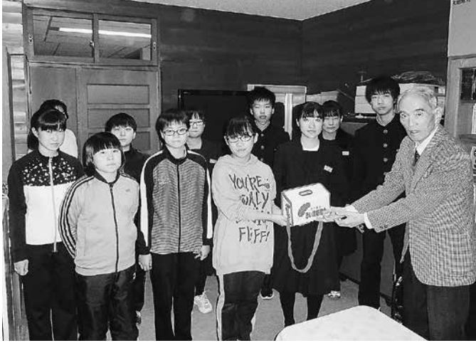
江差北小学校児童会・江差北中学校生徒会の皆様

発行 社会福祉法人 江差町社会福祉協議会 〒043-0032 江差町字新栄町264-2(江差町老人福祉センター内) TEL 0139-52-2441 FAX 0139-52-0560 ホームページ http://www.shakyo.or.jp/hp/48/