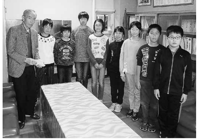
江差小学校代表委員会の皆様