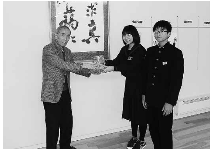
江差中学校広報専門委員会の皆様