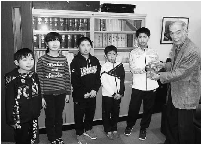
南が丘小学校児童会の皆様