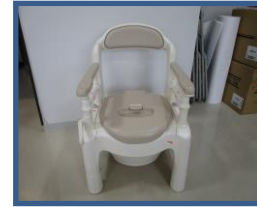
ポータブルトイレ