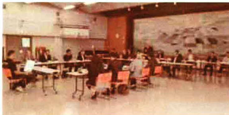
新評議員による定時評議員会の様子

6月16日(金)定時評議員会を開催し、平成28年度の事業報告と決算等が承認されました。 事業報告と決算の概略は、以下のとおりです。