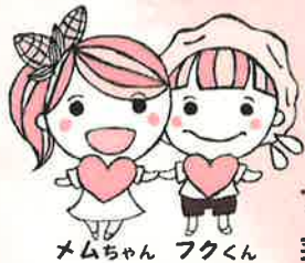
メモちゃん フクくん