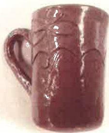
作品イメージです