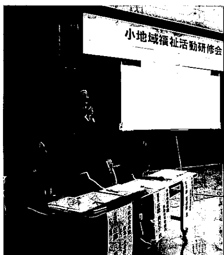
救急・搬送時の対応事例について紹介がありました。

新たにした後、活用方法等についてのグループワークを行い、「サロンや老人クラブ等で繰り返し啓発することが必要」などと、地域での普及に向けた活発な意見交換が行われ、利用促進を図る貴重な機会にすることができました。 今後も町内会等で、救急カードの普及に向けた研修会などの開催を希望される場合は、お気軽に事務局までご相談ください。 ◇問い合わせ 地域福祉係 ☎(27)2525