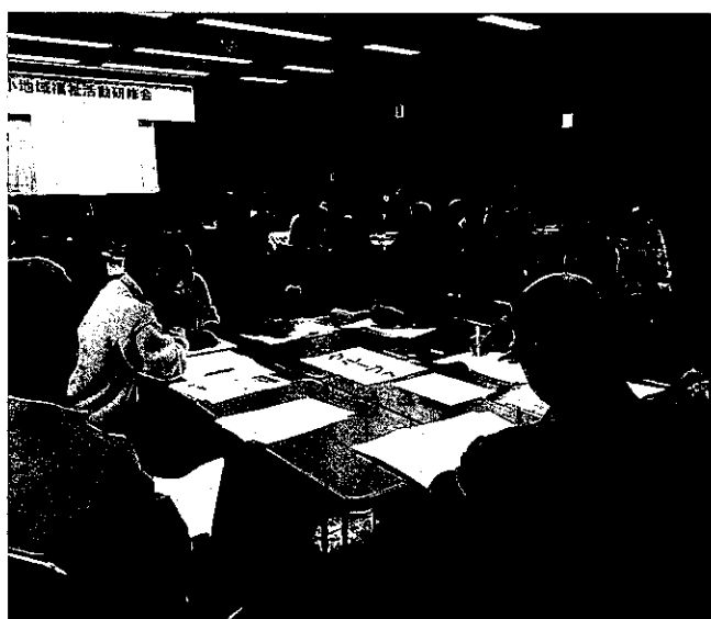
グループワークでは自分自身や地域で出来る備えについて、意見交換が行われました。

(主唱)千歳市町内会 連合会・千歳市民生委員 児童委員連絡協議会・千歳市社会福祉協議会 ・千歳市共同募金委員会